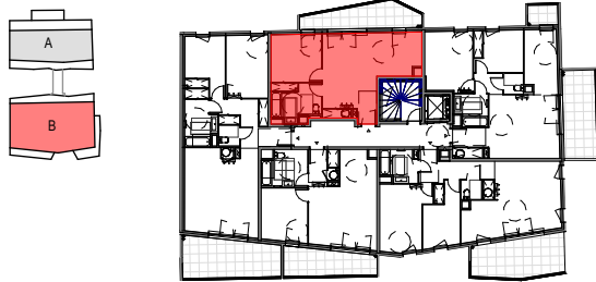
Tableau de répartition des surfaces