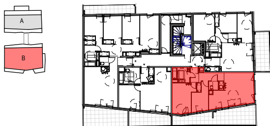
Tableau de répartition des surfaces